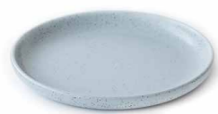
Keltenschale für Grill und Backofen H 4 cm | Ø 37,5 cm | 2,6 kg