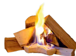
Feueranzünder L 23 cm | B 11 cm | H 5,5 cm | Vol. 150 ml | 0,8 kg