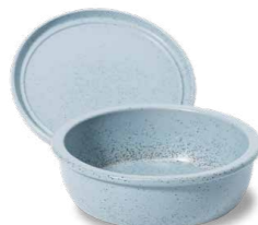
Keltentopf® mit Keltenplatte H 9 cm | Ø 30,5 cm | Vol. 3,0 l | 2,7 kg H 2,7 cm | Ø 30,5 cm | 1,4 kg