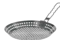
Grillpfanne mit klappbarem Griff aus Edelstahl Ø 31 cm | H 3,5 cm | 600 g