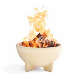
Feuerschale Ø 34 cm | H 18 cm | 6 kg