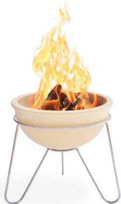
Feuerschale XL mit Gestell aus rostfreiem Edelstahl Ø 46 cm | H 40 cm | 10,7 kg