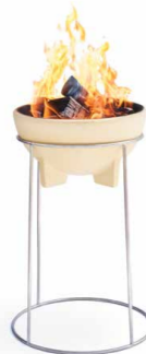
Ständer für die Feuerschale H 50 cm | Ø 34 cm | 2,0 kg